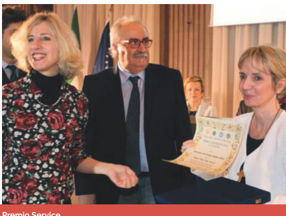
Premio Service Anno 2014 Progetto contro la violenza sulle donne "Casa Veronica"