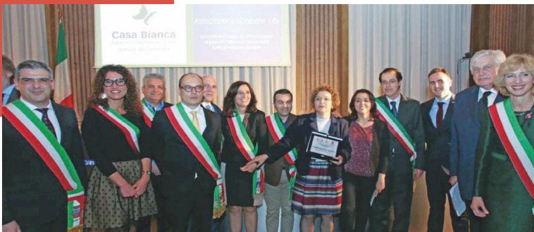
Premio Service Anno 2017 Tecnologie Innovative per il diabete pediatrico

tere i progetti da far pervenire attraverso i consiglieri. Tutte le proposte vengono valutate e discusse in maniera corale. Qualche volta vengono anche invitati gli attori per capire di più, per un ulteriore confronto. La prima proposta è arrivata dallo Spazio Donna di Bassano. Si tratta della ristrutturazione di una stanza in cui creare una casa-rifugio anonima per donne maltrattate. L'altra indicazione, invece, è un sistema permanente di sollevamento che aiuterà gli ospiti non autosufficienti della casa di riposo Sant'Angela di Breganze per facilitare, e non poco, le operazioni collegate all'igiene. Il sistema sarà in grado di trasferire direttamente gli anziani verso le sale da bagno. Il consiglio, riunitosi più volte in video conferenza, ha preso in considerazione queste proposte, arrivate in tempo utile e ha espresso il vincitore».