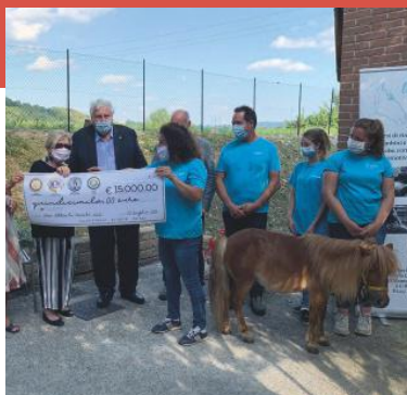
Premio Service Anno 2019 ASS. "Oltre le Parole" Pet Therapy - Ippoterapia